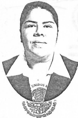
Secretaría de Educación de Veracruz Instituto Veracruzano de Educación Superior Dirección General