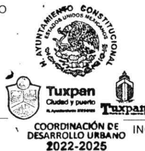
COORDINACIÓN DE DESARROLLO URBANO 2022-2025