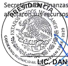
LIC. DANIEL CORTINA MARTÍNEZ PRESIDENTE MUNICIPAL

Los remanentes generados por el fideicomiso, una vez cubiertos los pagos de certificados y obligaciones, son transferidos a la Secretaría de Finanzas y Planeación (SEFIPLAN) y distribuidos entre los municipios en proporción al porcentaje con el que se afectaron sus recursos.