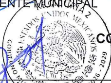
COMISION DE HACIENDA